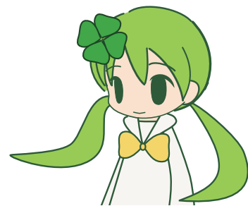
写真は二期に登場する「クローバーちゃん」

『未来探偵ソラとピヨちゃん エピソード・01+02』 『未来探偵ソラとピヨちゃん エピソード・ホーンテッド』 『未来探偵ソラとピヨちゃん エピソード・エッセンシャル』 この三作がリリース中だ。それぞれ数話の事件が収録されている。連作短編だから、どれからプレイしても楽しめる。 「忙しい人は『エピソード・エッセンシャル』だけでも見てほしい。主要エピソードの再録もあるから、これ一本でバッチリだ」フワフワソさんは熱く語った。