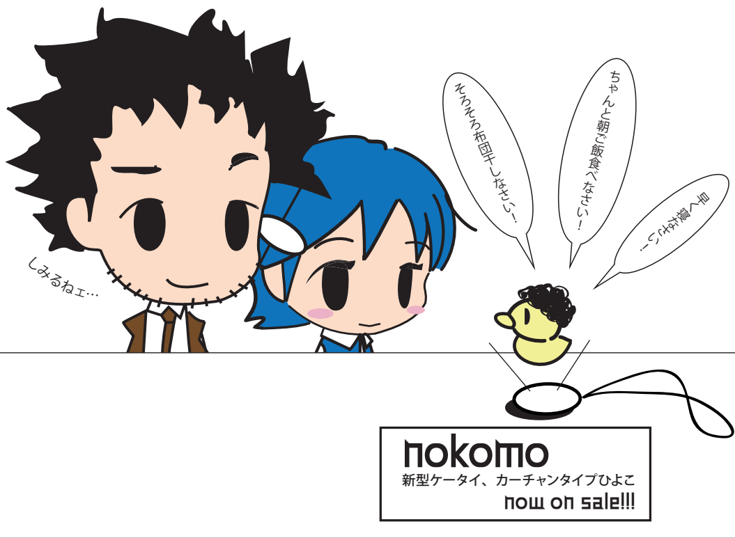
未来探偵ソラとピヨちゃん 第168話「ケータイショップにやってきた」 by フワフワソ